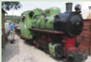
Muzeum průmyslových železnic