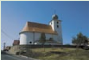
Kostel v Lukovanech