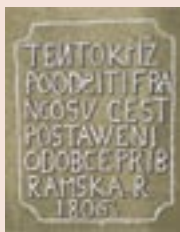
Detail pamětního kříže

„Tento kříž po odgiti Francosv gest postaveni od obce Příbramské. R. 1806.“