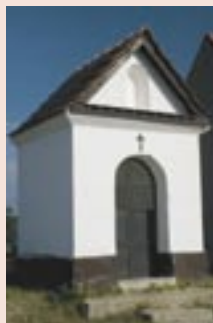
Kaplička na okraji obce z 18. století