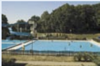
Koupaliště s tobogánem

Zbýšov dříve býval nevelkou osadou, která náležela k oslavanskému panství. Kolem roku 1820 však dochází ke zlomu. V okolí jsou objeveny zásoby uhlí a těžbu zde zahajuje první těžbařská společnost Rahnova, později nazvaná Láska Boží.