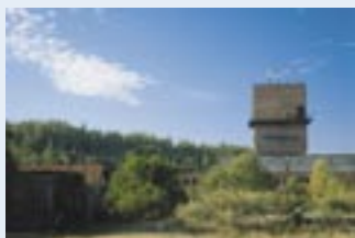
Důl Jindřich II

Důl Jindřich II se stal svou hloubkou 1550 metrů nejhlubším dolem na černé uhlí v ČR a patřil i k nejhlubším v Evropě. Hloubení dolu probíhalo v letech 1964–1969. Nepřehlédnutelná těžní věž se nachází severovýchodně od centra města a je pro veřejnost nepřístupná.